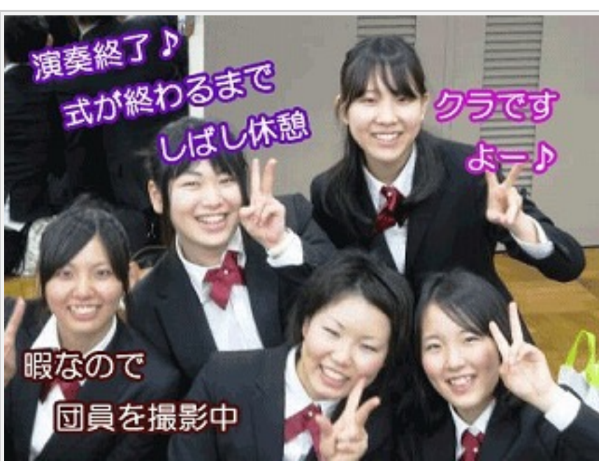
演奏終了・反省会/搬入待機