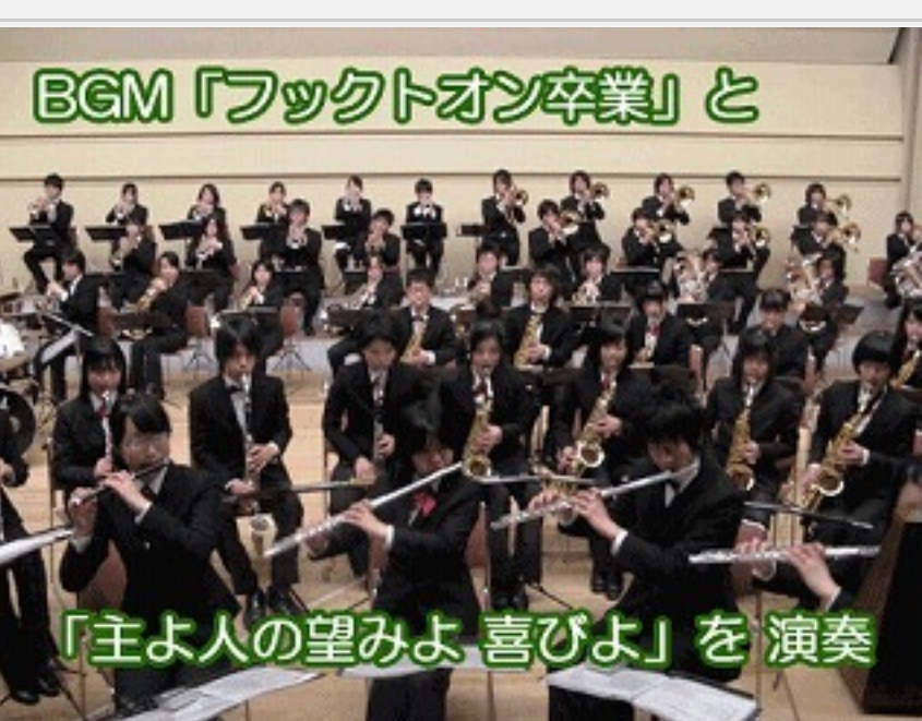
BGM「フットオン卒業」と「主よ人の望みよ喜びよ」を演奏

式が始まるまでの間、緞帳の裏で BGM を吹いています。 客席の様子が見えないから、いつもより緊張しないかも？ 「 フットオン卒業 」と、「 主よ人の望みよ喜びよ 」を演奏しました。 下は指揮者の位置から撮った写真。