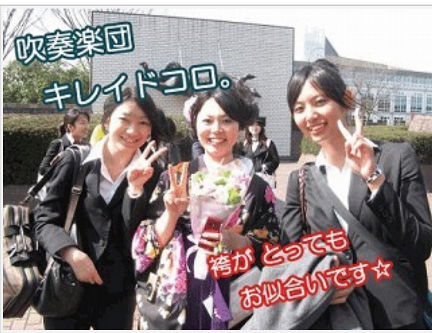
卒業された先輩たち