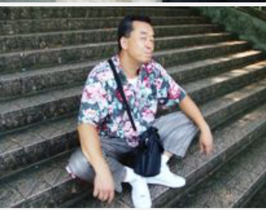
上右：団長 上左：番長 左：親分