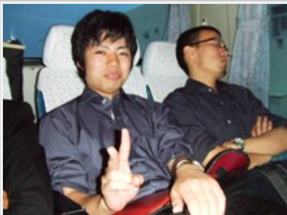
朝の6時からの焼津遠征、演奏に運営のお手伝いまで。みんな頑張りました！ 疲れたらバスの中はみんな寝ちゃいますよ。上は典型的な帰りのバスの図。 下はイレギュラーな人