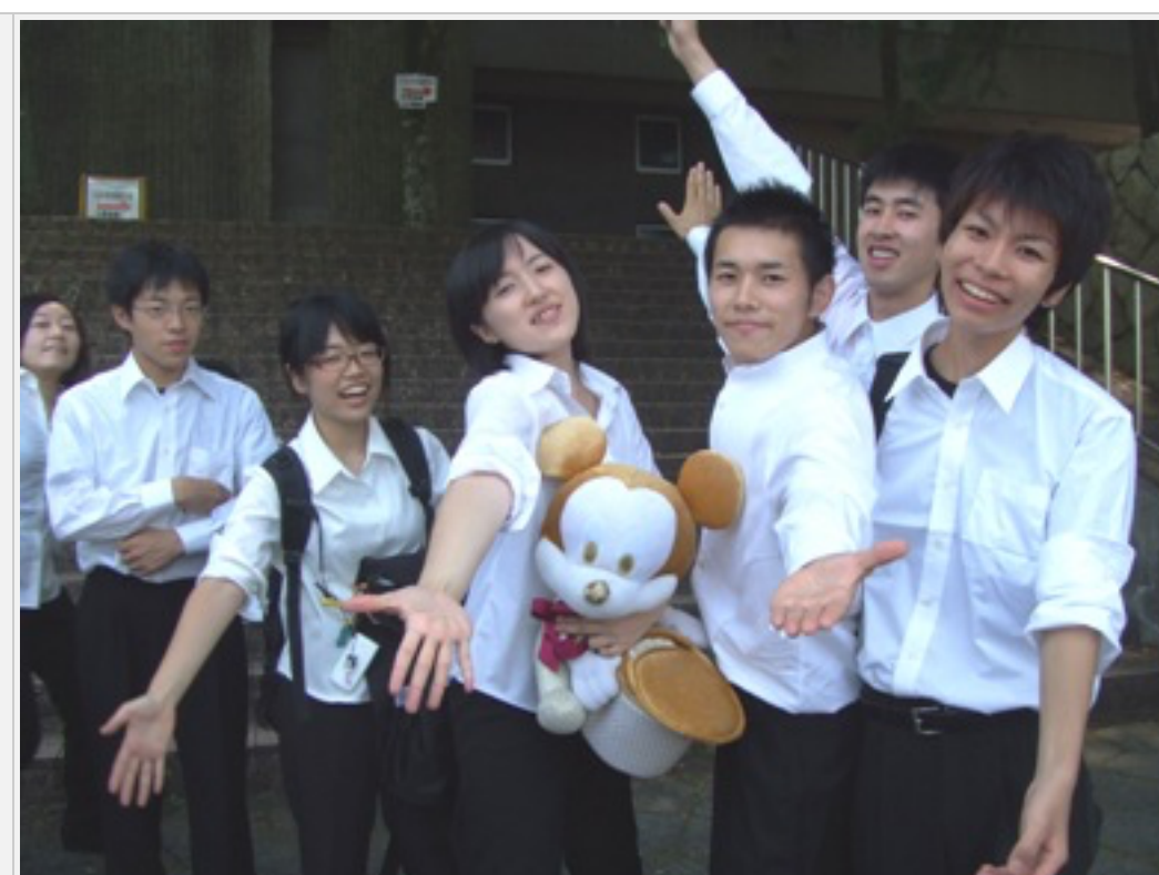
本番当日の朝は6:30より大学で練習、10時に大学を出発しました。写真は出発前にしたみなさん。本番の衣装に身を包み次第に緊張も見えてきました。 左の構成図はフィクションです。いいえ、一部ノンフィクションです。