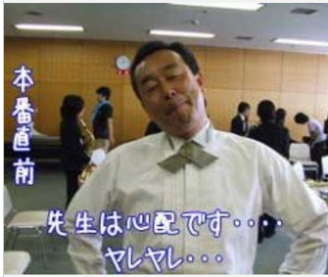
本番前、音だしとチューニングの様子です。みんな緊張してる?? 本番前なのでインタビューは控えておきましょう。テンションの上がった団員が何をしてくるか分かりません！実際カメラを向けただけでみんな変なポーズを決めちゃいます。上の写真が一番まともですよ。他の写真は見せるもんじゃないっすよww さて、本番は13:22からです。おながが空いてきた頃ですが、打楽器の搬入も完了！舞台袖待機もばっちりです！