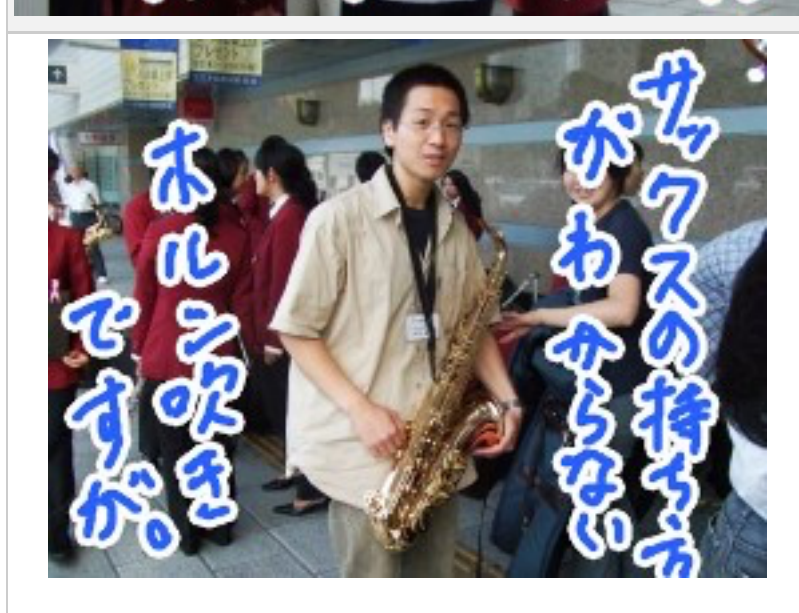
お手伝いに来ただけど、どうしていいかわからない(笑) そんな某ホルン吹きでした・・・