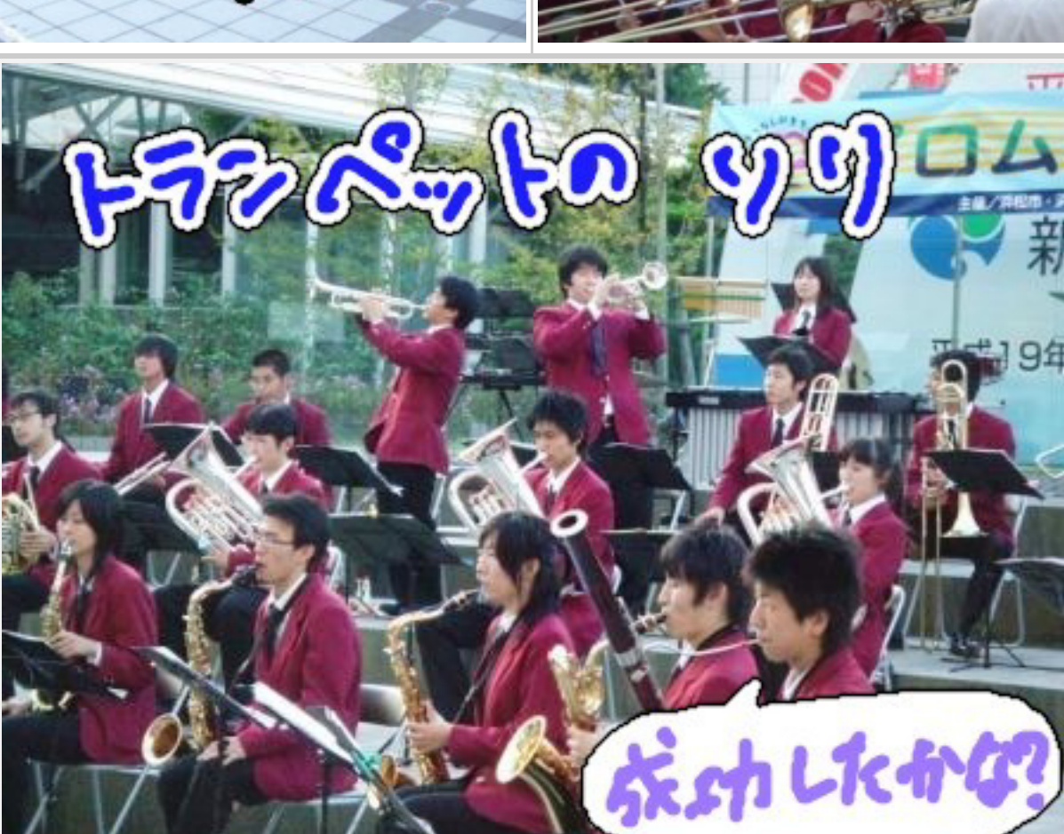
こちらへんで叫んじゃいましたー。ブラボー！！