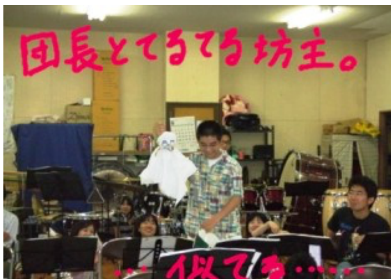
当日の雨が心配されて・・・練習室はてるてる坊主がいっぱいでした。てるてる坊主団長！？